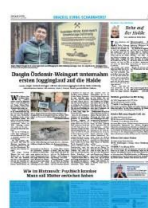
1/4 Seite quer 7sp./100 mm