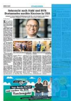
1/3 Seite hoch 2sp./450 mm