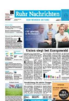
Titelfuß 1sp./50 mm