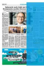
1/2 Seite hoch 3sp./450 mm