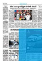
1000er Eckfeld 4sp./250 mm