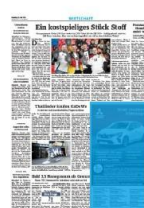
Eckfeld 1/4 Seite 3sp./250 mm