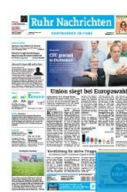
Titelfuß 2sp./100 mm