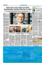
1/3 Seite quer 7sp./150 mm