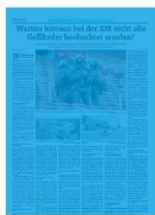
1/1 Seite 7sp./450 mm