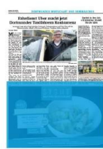
1/2 Seite quer 7sp./225 mm